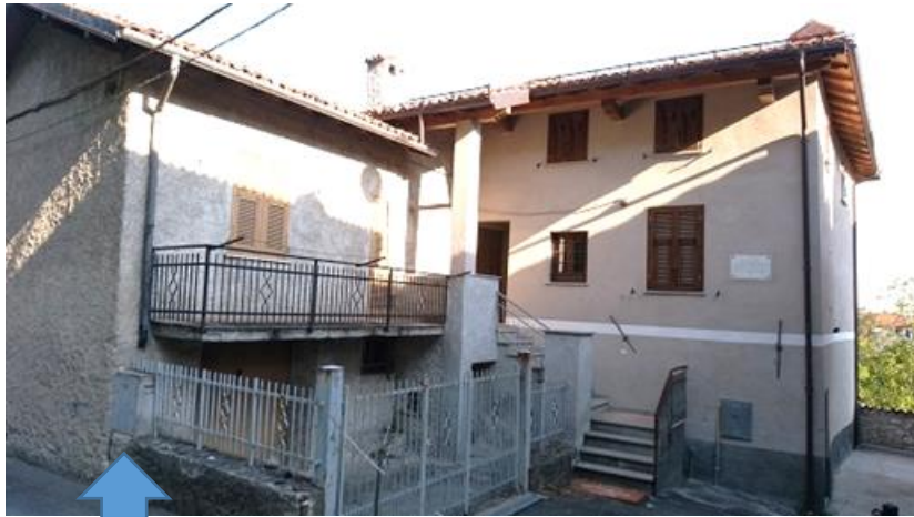
ヴァルジェラータ通りの家