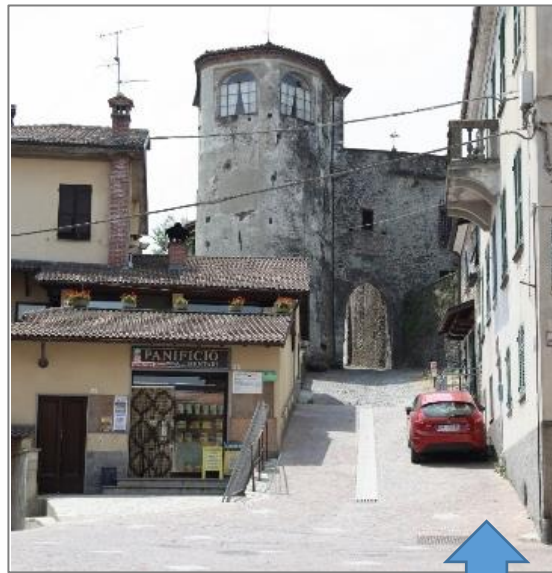
ボルゴアルト通り